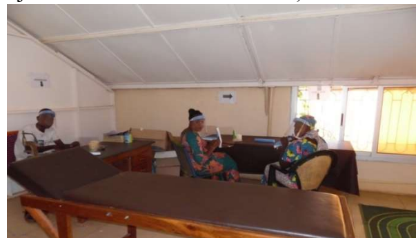
Fabrication des visières du CICR

L'accompagnement financier et humain de l'AAPBV a donc permis d'éviter la fermeture définitive du centre, de protéger le personnel par les mesures barrières contre la COVID19 et d'obtenir un marché de fabrication de 6000 visières aboutissant à une recette de 27 000 000 FCFA soit 41 161€ !