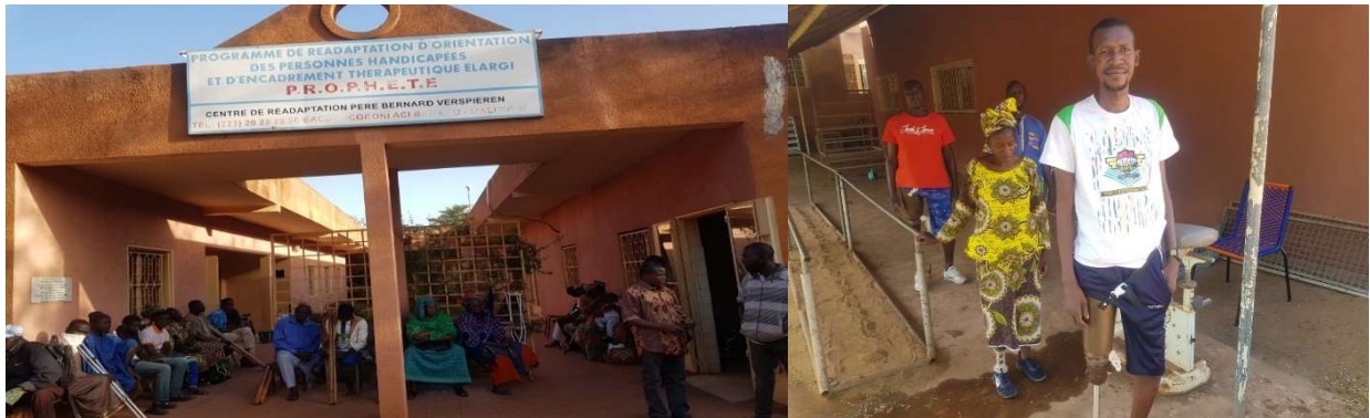
Consultation de masse des victimes de mines