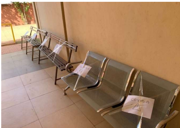
Mise en place de la distanciation sociale