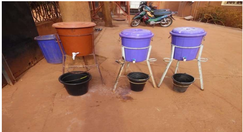
Poste de lavage des mains à l'entrée du centre

Au Mali, nous avons relevé jusqu'au 31 juillet 2020, 2535 contaminés par le virus dont 1937 guéris pour 75 décès. (Source INSP). Aux premières heures de la maladie en début mars, le centre a été touché suite au passage d'une personne contaminée venue en consultation pour une échographie cardiaque. Suite à la visite des agents de la Direction de la Santé, les travailleurs qui ont eu un contact direct avec le patient ont été mis en quinzaine. Afin de garantir la sécurité des patients et du personnel, le Centre a été fermé, ce qui a provoqué l'arrêt des soins pour les patients en cours de traitement, la mise au chômage de l'ensemble du personnel et la perte des revenus de consultation. Avec le risque de voir le personnel, privé de ressources et sans aide de l'Etat quitter définitivement le Centre.