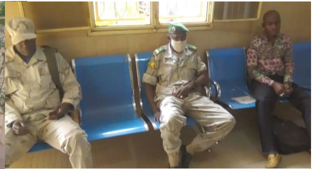
Soldats victimes de mines