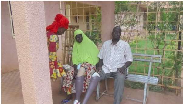
Victimes de mines appareillées

Après quelques séances d'essayages et de mise en confiance, le CPBV a procédé à une remise provisoire de 8 prothèses. 4 autres prothèses sont actuellement en cours de fabrication.