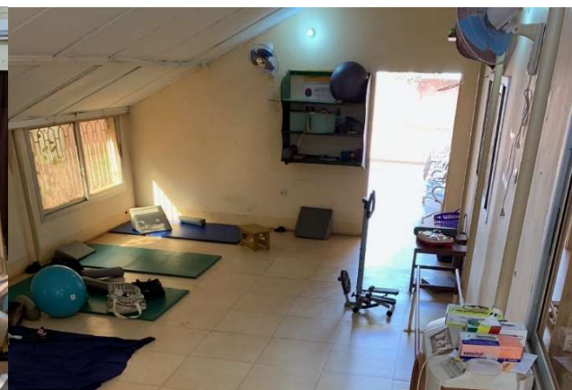
Salle de rééducation en kinésithérapie enfant