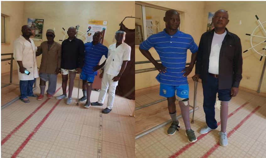
Kinésithérapie avec les nouvelles prothèses

Nous allons prochainement lancer des campagnes d'appareillage dans les différentes régions du Mali malgré le contexte très difficile dans les domaines sécuritaire, économique, social et sanitaire. Les nombreux remerciements et témoignages des bénéficiaires nous motivent davantage encore pour poursuivre cette mission.