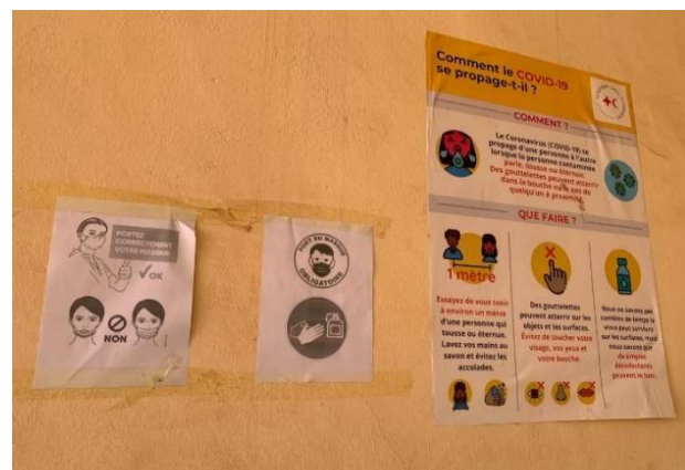
Affichage des consignes liés à la COVID19