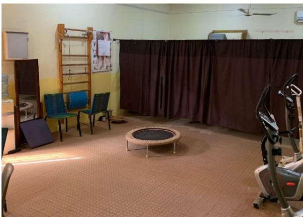
Salle de rééducation en kinésithérapie adulte

Pour le confort des patients, nous avons réaménagé la salle de kinésithérapie en créant une nouvelle salle destinée à la rééducation des enfants afin de les séparer des adultes qui étaient parfois gênés par les cris et/ou pleurs.